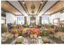
ウブドバリ Ubud BALI