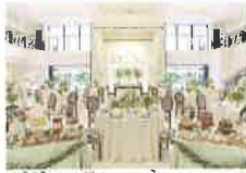
パリ ラフィネ PARIS Raffine