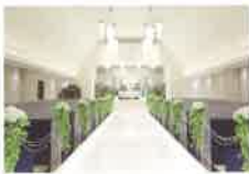
シャンデルチャペル Chandelle Chapel