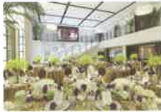
ニューヨーク エスカリエ NEW YORK Escalier