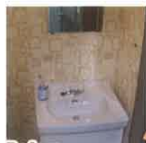
Before ごちゃごちゃと片付かなかつた洗面所が...