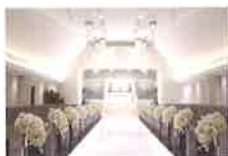
シャンデルチャペル Chandelle Chapel