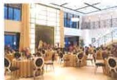
ニューヨーク エスカリエ NEW YORK Escalier