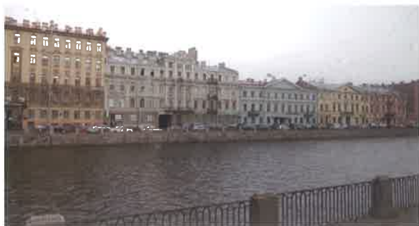
壁面がくっつけられて立ち並ぶビル群。黄色系は19世紀に多く、青色系は18世紀に多い。

サンクトペテルブルクは、ベニスと同様湿地帯を埋め立てた土地のため、石造りの建物は沈下せぬよう地中深く基礎杭を沢山打込んだ上に立てられている(ごまかしをしたらたちまち傾く)。しかし、この地方には地震が発生しないので、地震対策は零。高い