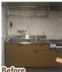
Before 狭くて料理がし辛かったキッチンが...