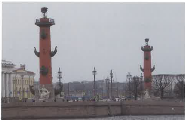
灯台付き戦勝記念塔。沈めた敵軍船の船先(へさき)を飾っている。