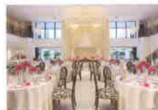
パリス ラフィネ PARIS Raffine