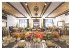
ウブドバリ Ubud BALI