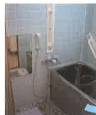
Before 狭くてくつろげなかつた浴槽が...