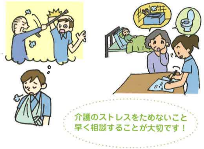
(図表-3) 家族の心理的経過

認知症になりますとそれ以前とは人格、行動が変化しますから、以前と比較しがちで、身内の行動に対し、絶望感や認知症の特異性（長期にわたって進行していく症状や生活の行動障害など）からつぎのような心理的ストレスの経過をたどります。