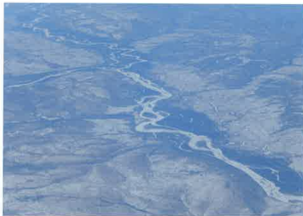
凍土で覆われた大地の下には無尽の地下資源

一般のロシア人は、早く日本と国交を正常化させて先端技術を導入したり、シベリアの大地に眠っている天然資源を日本に輸出したい、日本に旅行したい